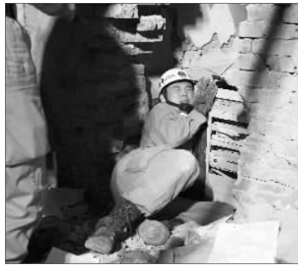
5 月 15 日零时,洛阳消防抢险救援突击队队员在废墟中摸索被困人员的位置。