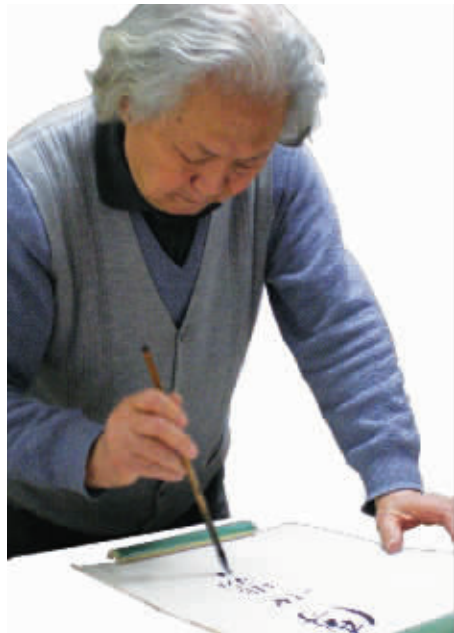
故宫博物院原副院长杨伯达认为，翡翠是玉中之王，在清代达到顶峰，乾隆皇帝御封，让“传世翡翠”名扬四方。

“翡翠作为玉中之王，在清代发展达到顶峰，无论皇室还是民间，无人不喜爱翡翠。乾隆皇帝御封，让‘传世翡翠’名扬四方”。由云南美术出版社出版的《传世翡翠260年传奇》一书日前正式发行，故宫博物院原副院长、玉学泰斗杨伯达教授欣然为该书作序，并为我们解密一个值得“为自己，更为下一代珍藏”的 TESIRO 通灵旗下品牌——“传世翡翠”260年前受到皇室热宠的传奇。