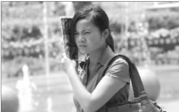
怕晒黑,街上女孩用报纸挡脸

快报讯(记者 刘峻)昨天,南京的最高气温达到33.1°C,创下今年以来的最高气温纪录。省气象台专家说,现在和真正的夏天还不一样,昼夜温差大,早晚相对还是比较舒适的。