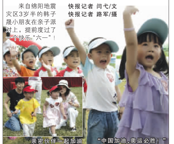
亲密伙伴一起加油 “中国加油,奥运必胜!”