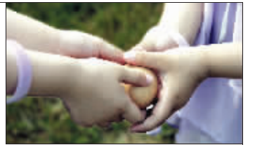
“鸡蛋象征生命,我们要用双手保护它!”