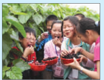
小朋友在园里摘桑葚