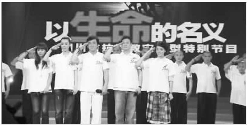
成龙等明星向赈灾英雄敬礼