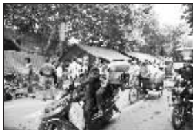
20万人日内完成撤离