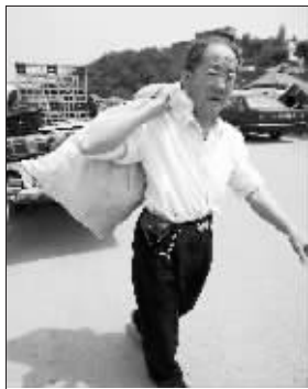
正在疏散的当地居民

今日上午8时前,唐家山堰塞湖避险疏散预案三分之一溃坝方案涉及的19.75万下游群众将全部撤离到预先设定位置。并且从今日起至6月2日,绵阳市将进行全溃坝淹没线以下人员疏散撤离指挥系统演习。