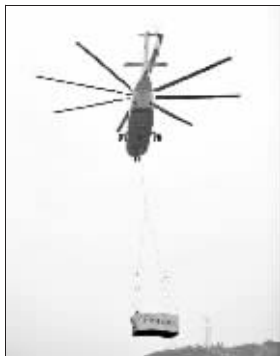
直升机连续吊来重型装备抢险