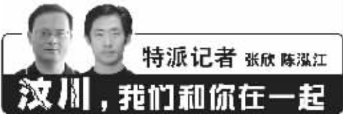
特派记者 张欣 陈泓江

到前晚20点为止,在唐家山堰塞湖坝顶施工的工程人员和机械已经全部撤出,在附近的观测点上,只留下少数观测人员。从昨天的贮水量看,预计唐家山堰塞湖将从明天开始自然泄洪。