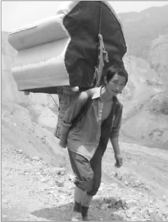
一位男子背着家里的沙发撤往安置点

6月1日零点,唐家山堰塞湖应急疏通工程正式完工。绵阳市已经接到水利部唐家山抢险指挥部的通知:唐家山堰塞湖将采取自然泄洪的方式,预计6月3日湖水将沿导流槽泄洪。昨天,记者往返600里前往堰塞湖区和涪江沿岸泄洪区采访,详细了解这里的情况。