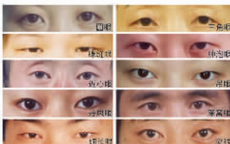
图释(1) 很适合手术的眼睛的类型

最美丽的眼睛,必定绽放桃花般的风采、神韵和灵气。周院长的“桃花眼”手术特点:眼睛大而圆,眼外侧向外上方扬起,同时双眼皮形状内窄外宽向外上方舒展,真正实现小眼、圆眼、三角眼、眯缝眼、肿泡眼、细长眼向标准“桃花眼”完美蜕变。