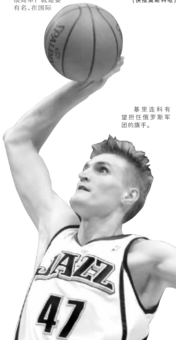
基里连科有望担任俄罗斯军团的旗手。