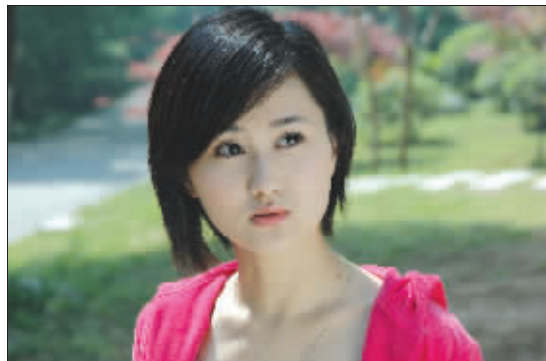
《我就是明星》拍摄现场

江苏影视频道大型互动栏目《我就是明星》周日晚四朵金花演出校园剧《女生向前走》之《缘来是你》,女孩们在剧情的安排下各得其缘。节目从上周作出特别调整后,近期每场原定的晋级赛均不做人员淘汰,可谓是没有硝烟的“战场”,重在让每个女孩保持最佳状态演出故事大结局。