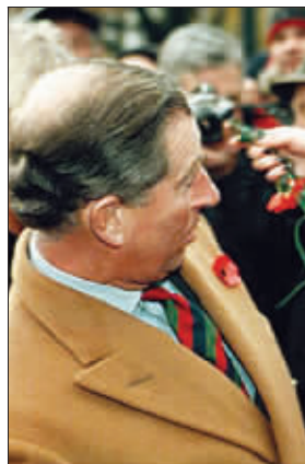
英王储查尔斯头上也成了“地中海” 资料图片

这项克隆技术研究期间,美国、意大利和日本的科学家也在进行克隆头发的实验,包括尝试从头发毛囊中提取干细胞。