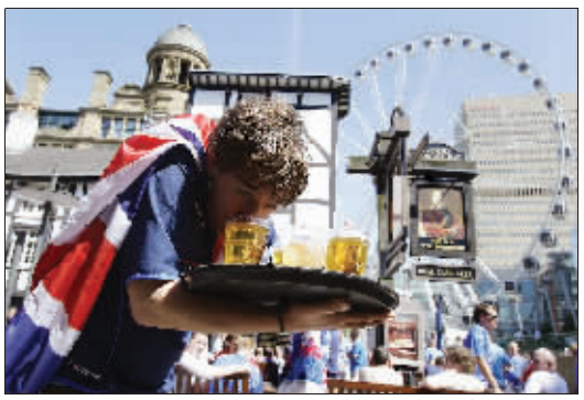
英国街头一名喝啤酒的男子

为控制局面,英国铁路警方派人维持秩序,同时向伦敦警察局请求支援。利物浦街站、尤斯顿站、贝克街站等多个地铁站被关闭。英国《每日电讯报》报道,醉酒者袭击了4名列车司机,3名地铁员工,2名警察,损坏了1辆警车和数辆列车,还令一名警察受伤。铁路警察局发言人说,已有17人因破坏公共秩序、袭警、吸毒等遭逮捕。杨舒怡(新华社)