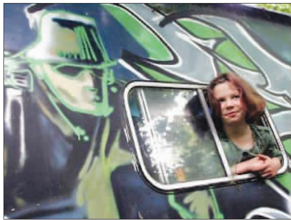
1000英镑廉价房车涂鸦

10年前，当时名不见经传的英国艺术家班克斯在英国诺福克郡一对贫困夫妇所住的廉价房车车身上绘制了一幅涂鸦之作。令这对夫妇做梦也没想到的是，10年后，现年34岁的班克斯如今竟一跃成为英国最著名的头号涂鸦艺术家，令他们的那辆绘有其涂鸦之作的汽车也跟着“鸡犬升天”，从当初的1000英镑升值到了50万英镑！