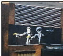
班克斯的涂鸦作品

据悉，目前妮尔夫妇正打算以50万英镑天价出售这辆活动房车，并打算利用卖车得来的钱购买一幢真正意义上的豪宅，从而使自己和4个儿女有足够的居住空间。妻子妮尔说：“我们全家人在整个英国已经游荡了10年，现在需要安定下来。而我们看到班克斯的作品价格正越来越高，因此觉得现在出售这辆房车正是时候。我们希望班克斯的涂鸦能让我们拥有自己的新家。” 旺旺