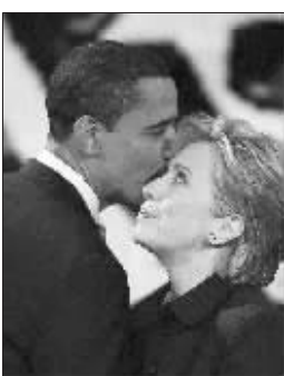
奥巴马与希拉里 资料照片

根据希拉里竞选班子时任首席政治策略师马克·佩恩的设想,希拉里只需争取民主党全国代表大会代表名额较多的几个大州,放弃一些代表名额较少的州和选举形式为党团会议的州。在这一战略指导下,希拉里忽视了基层助选组织建设,把不少代表名额拱手让给奥巴马。 卜晓明