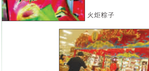
中央商场浓厚的端午氛围