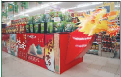
蔬果超市的“龙舟粽”