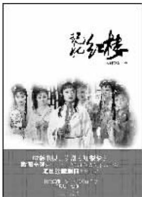
欧阳奋强 上海锦绣文章出版社友情推荐

87版电视连续剧《红楼梦》承载了成千上万的中国电视观众的记忆,也承载了上百个演职人员对那段青春岁月的斑斓记忆。本书以贾宝玉的扮演者欧阳奋强的自述,回顾、还原了《红楼梦》这部中国电视剧史上的经典之作的拍摄全过程。