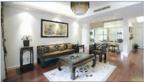
金鼎湾国际的精装修出自意大利名师之手

现场销售顾问介绍说,金鼎湾国际出自南京著名的建邺开发集团之手,作为“住宅产业化的先行者”,金鼎湾国际拥有很多项目无可比拟的优势,从产品设计、配套设施、物业管理到精装修均贯彻纯板式大宅的定位,打造专属于金鼎湾国际的优质生活圈。记者还了解到,金鼎湾国际在软件服务上下足了功夫。小区内还开辟了亲子乐园,会所内还精心打造了红酒吧和雪茄吧。