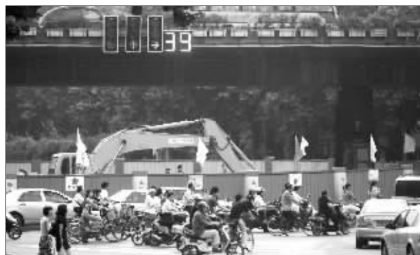
转盘改造 拥堵加剧 草场门大转盘改十字平交路口工程,目前已启动拆迁工作,路面交通出现拥挤。改造预计 7 月底完成。