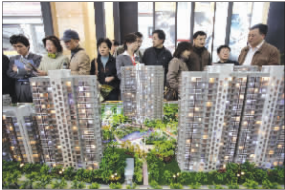
楼盘放量,购房人选择余地大

南京网上房地产数据 显示,6月16日至6月22日,全市普通住宅 共计上市量为9.36万平 米,与前周相比下降了 24.79%,认购面积为 10.24万平米,环比上升 了8.36%,共计认购 1023套,成交947套;日 均认购套数为146套,相 比上上周日均认购量多 了2套。