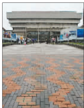
野兽派风格的图书馆

英国伯明翰中央图书馆因外观设计不佳,人们对它的批评声不绝于耳,有人甚至称其为“英国最丑陋建筑物之一”。伯明翰市政府计划将其拆除重建。英格兰遗产委员会却认为,中央图书馆代表了伯明翰的一段历史,不仅不应拆除,反而应该加以保护。