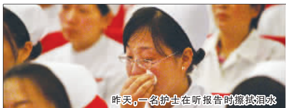
昨天,一名护士在听报告时悄悄拭泪