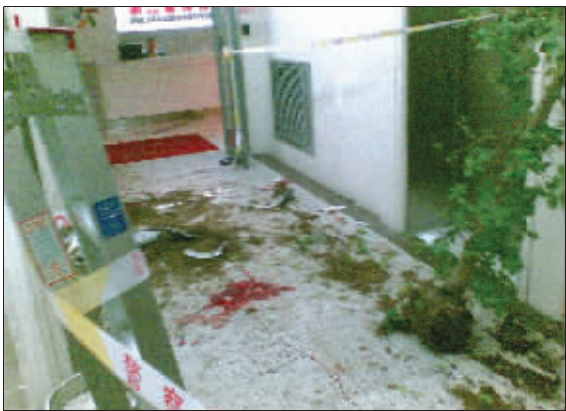
12楼电梯口,发生冲突后的现场