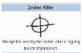
信末星象图案标志

上世纪60年代末起,美国旧金山地区接连发生20多起恐怖的连环杀人案,一名自称“黄道带杀手”的凶手,每次作案之后都会向警方和媒体发送含有密码的信件炫耀他的杀人经过,该系列案件至今未被侦破。令人做梦也没想到的是,在沉寂34年后,“黄道带杀手”竟再次现身。6月21日,北卡罗莱纳州一家旅馆发生了一起怀孕女兵陈尸浴缸的谋杀案,28日当地报社突然收到一名自称是凶手的人写来的信件,而信中使用的正是“黄道带”杀手特有的星象图案标志!