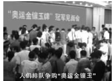
人们排队争购“奥运金镶玉”

深刻的内涵,依据“五行说法”:东方为青、南方为赤、西方为白、北方为黑、中央为黄,“青”即为碧,“奥运金镶玉”选择优质的“和田碧玉”,意喻中国在世界的东方、碧玉代表中国,体现出奖牌藏品的至尊身份和中国特色,也完全符合2008盛会“绿色奥运”的理念。“和田玉”已成为国家的稀缺资源,在最近短短的20年中价格飙升了2000多倍,现正以每年50%的速度暴涨,再加上奖牌藏品强劲升值的惯性,今天9830元,以后就是加价十倍、百倍也买不到!