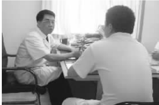
南京建国男科医院专家在接诊时,耐心的为患者分析病情,做到规范医疗。

同倡议的“男科医疗规范年”,其首要任务是推广男科前沿技术,严格规范男科疾病的诊疗行为,并在全国范围内选择十二家最具技术资质及品牌影响力的专业男科医院作为区域推广、指导、普及单位,其目的是指导新技术、新设备的临床科学应用,规范(男科诊疗临床标准)行业行为,倡导实事求是的高尚医风,更好地保障患者的权益。南京建国男科医院以其资质和品牌影响力,荣幸的成为江苏地区唯一一家承担 2008' 男科治疗规范年系列工作的医疗机构。据建国男科医院近期的临床统计:各类泌尿感染疾病患者占所有就诊患者的 23%,那么该如何规范治疗泌尿感染疾病,建国男科医院男科专家又有何见解呢?