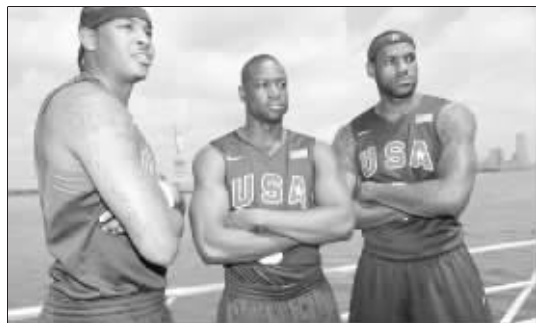
梦之队是重点保护对象

从奥运会的历史来看, 许多大牌明星总是不愿意住在奥运村里, 理由不外乎“不安全”、“去赛场不方便”等等。最喜欢搞特殊化的莫过于美国男篮了, 自从 1992 年奥运比赛开始使用 NBA 球员以来, 他们的队伍就从来没有出现在奥运村。