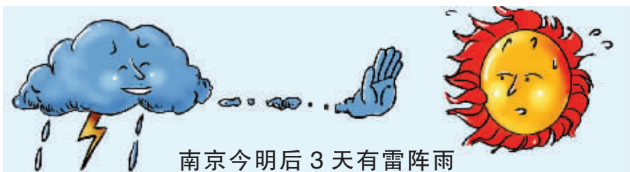
南京今后3天有雷阵雨

昨天,南京刮起西南大风,就是这股突然而至的奇怪的风,让南京城的高温得以缓解。省气象台专家介绍,持续的高温警报已经解除,今后南京将多雷阵雨,3天内高温暂时不会回头。但下周初,副热带高压势力有可能重新增强,第二轮高温将来临。