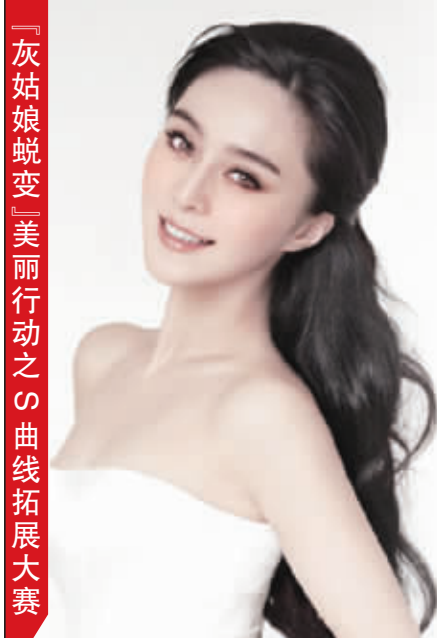
「灰姑娘蜕变」美丽行动之S曲线拓展大赛