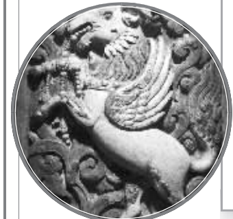
彩釉浮雕飞羊纹琉璃砖