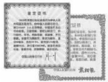
▲中国人民银行两任行长签名鉴定证书

与金币同时发行的还有佛教第一神图——《观音赐福图》,是世界“佛文化、绘画艺术”顶峰,深藏故宫博物院,贵为无价之宝。神图用 30 多克 999 黄金绝密打造,图中 16 尊观音形态各异,金光灿灿,每一尊都寓意一重福佑,是收藏投资、镇宅祈福、馈赠亲友的吉祥财富。