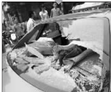
出租车玻璃被砸碎