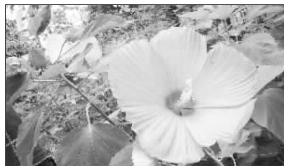
孩子:混血美人

“有女同车,颜如舜华。”从《诗经》开始,木槿,即“舜”,就被公认为是植物界的“大美人”。中山植物园的专家经过数年努力,用中外木槿杂交,培育出了两个新品种“姊妹花”,日前首次开花。昨天,记者在植物园看到,粉红色娇艳的花朵,竟然比一般人的脸还大,直径可达30厘米!炎炎烈日下,很多花儿也进入“夏眠”状态,木槿却开得正艳。