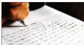
一根指头写出工整漂亮的字