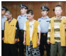
三名凶手被判无期徒刑