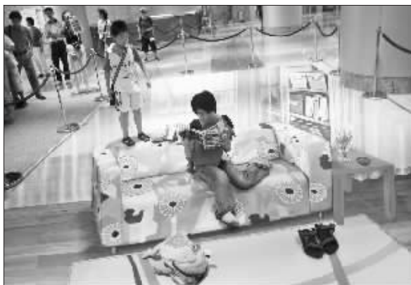
一市民体验宜家生活

已到,这是进入南京的进口家居用品第一大单,南京检验检疫人员已进行检验,预计检验结果