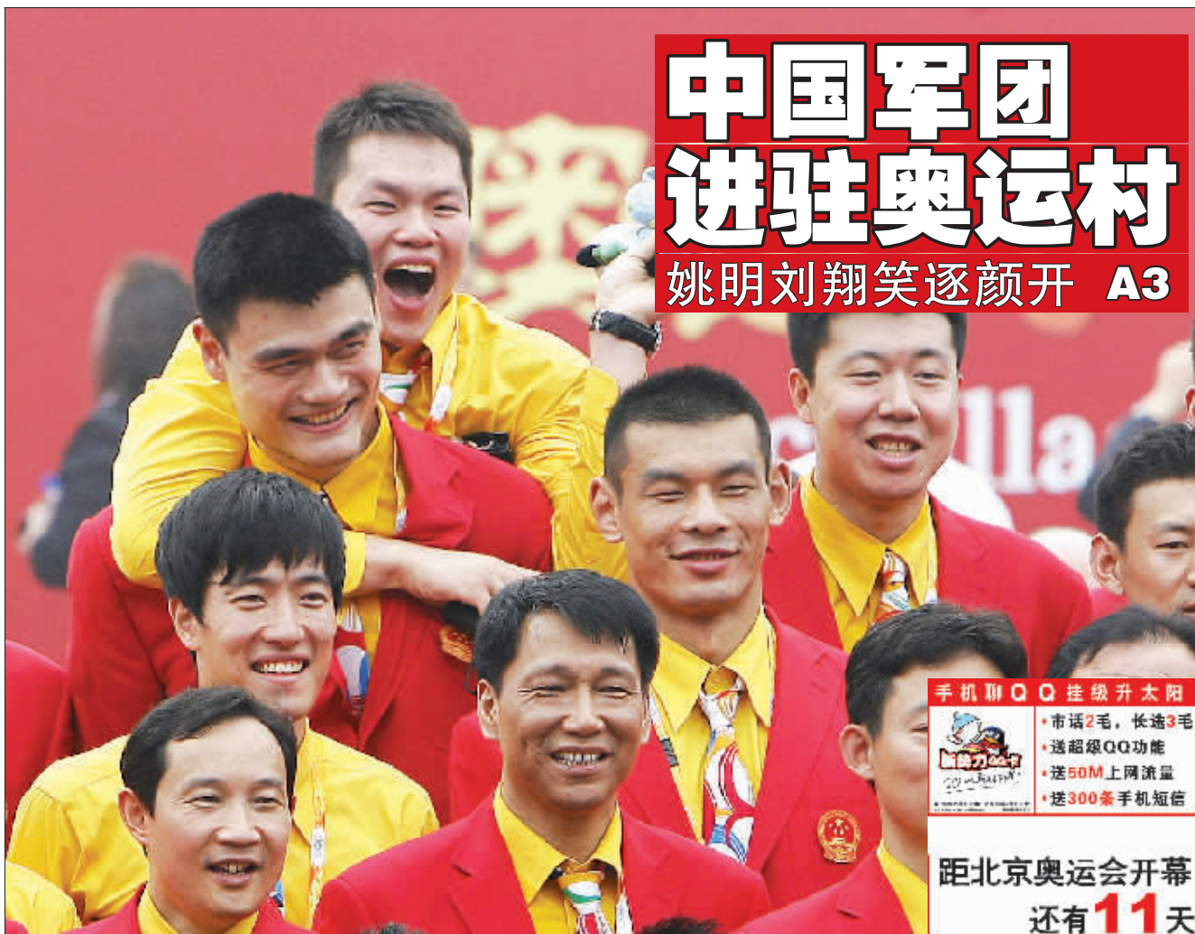
昨天,奥运村正式开村,中国体育代表团部分成员入住。