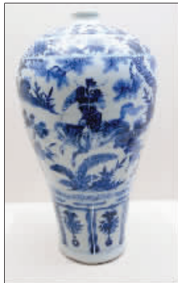
萧何月下追韩信青花梅瓶