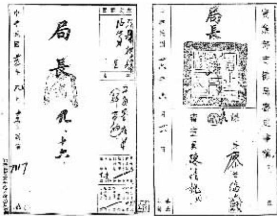
图片系1936年,张裕公司向当时的中华民国实业部商标局提交“解百纳”商标注册,并于1937年获得批准的注册证书,现保存于南京中国第二历史档案馆。

日前,国家工商行政管理总局商标评审委员会经过严谨的论证与评审,发出商标撤销复审决定书,裁定中国最早的干红葡萄酒品牌——“解百纳”的商标所有权归属张裕,并享有一切注册商标相关权益。该案由涉及诸多利益相关方、历时6年之久而被冠以“中国葡萄酒业知识产权第一案”。