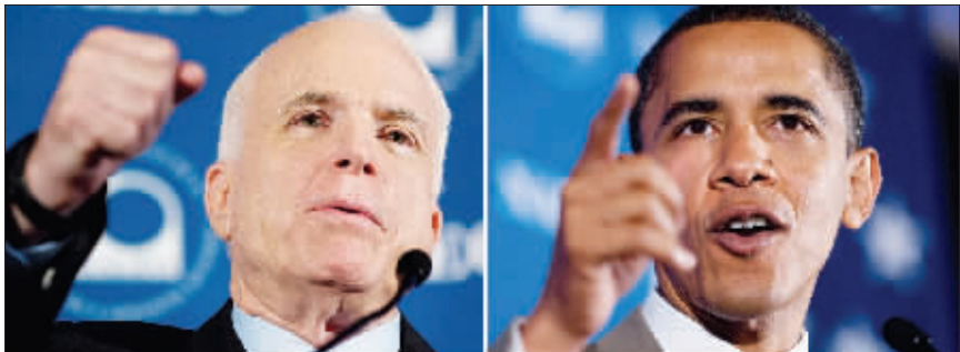
面对奥巴马(右)“国际巨星”般的风采,麦凯恩(左)“心虚”了?

美国民主党总统竞选人贝拉克·奥巴马一周前访问欧洲,获“国际巨星”般欢迎。共和党总统竞选人约翰·麦凯恩的竞选班子于是在7月30日投放一则广告,把奥巴马比作美国“小甜甜”布兰妮和“问题明星”希尔顿,暗示他公众关注度虽高,却像流行偶像一样幼稚、肤浅,讽刺这位受到媒体追捧的黑人参议员是在哗众取宠。