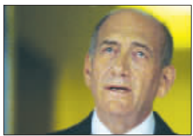
奥尔默特宣布9月辞职

以色列总理埃胡德·奥尔默特7月30日说,他将于今年9月执政的前进党选举新领导人后辞去总理职务。政治分析师认为,奥尔默特辞职将减缓中东和平进程。