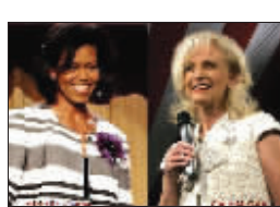
最佳着装米歇尔·奥巴马与休闲卷发的辛迪·麦凯恩

与此同时,麦凯恩夫人也在努力改变自己的刻板形象和个人声誉。7月初她终于放弃了死板的高髻发型,以休闲卷发形象出现,显然她也在努力让自己的形象看起来更有亲和力。