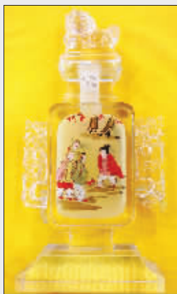
赠予国际足联的内画壶