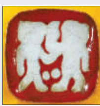
左为蹴鞠纹肖形印,右为蹴鞠图铜镜