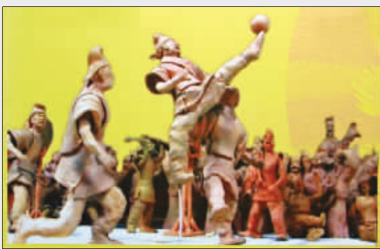
古代临淄的蹴鞠场景

“元朝时,蒙古族这个‘马背上的民族’对汉人的游戏非常排挤,皇帝不喜欢,民间也不再流行,乃至成为了一种不健康的活动,一些妇女把蹴鞠带进了青楼,成为青楼取巧的手段。所以到了明朝朱元璋时期,他明令禁止军队不能玩蹴鞠,违反命令者要砍掉一条腿。清代康熙和乾隆两代皇帝也是明确禁止蹴鞠的。”