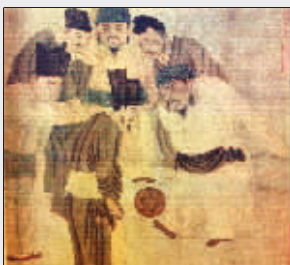
图为宋太祖赵匡胤、太宗赵匡胤和近臣赵普等一起蹴鞠玩乐的情景