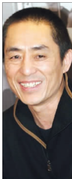
张艺谋:千万别下雨

据悉,8日晚7时56分进入开幕式倒计时,晚8时开幕式正式开始,将持续约三个半小时。开幕式文艺表演名为《美丽的奥林匹克》,分为上下两篇,约一个小时。上篇为《灿烂文明》,力图通过灿烂的文明,展示中华文化的渊源;下篇为《辉煌时代》,通过独具匠心的艺术手法,展现当代中国改革开放的建设成就和中国人民的精神风貌。