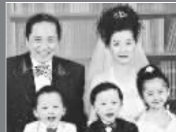
和第一任妻子及一女儿