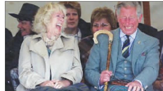
卡米拉忍不住放声大笑