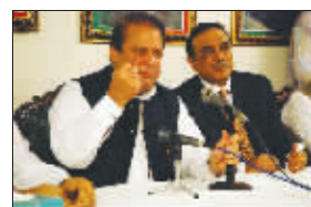
扎尔达里与谢里夫(左)