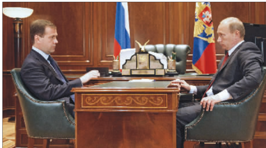
8月10日,俄罗斯总统梅德韦杰夫在莫斯科郊区总统官邸会见总理普京。