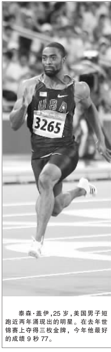
泰森·盖伊,25岁,美国男子短跑近两年涌现出的明星。在去年世锦赛上夺得三枚金牌,今年他最好的成绩9秒77。