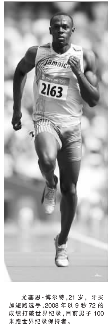
尤塞恩·博尔特,21岁,牙买加短跑选手,2008年以9秒72的成绩打破世界纪录,目前男子100米跑世界纪录保持者。