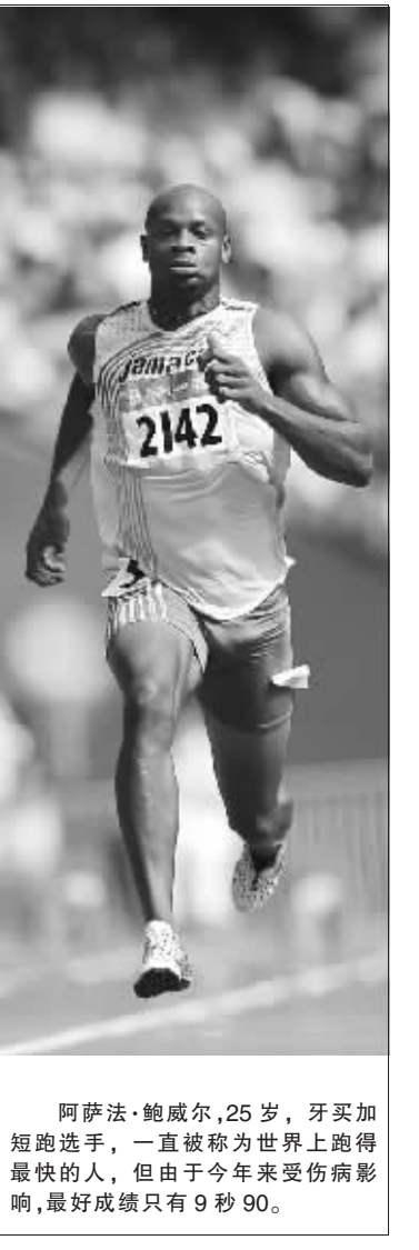
阿萨法·鲍威尔,25岁,牙买加短跑选手,一直被称为世界上跑得最快的人,但由于今年来受伤病影响,最好成绩只有9秒90。

除了刘翔参加的男子110米栏之外,男子百米飞人的比赛无疑是中国观众最为关注的,博尔特、鲍威尔和盖伊这三位顶尖百米高手,都憋着一口气要在“鸟巢”为了“世界第一飞人”的荣誉展开一场大战。