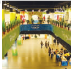
人都出去扫街打猎了