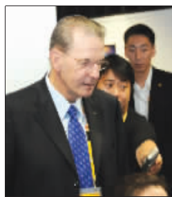
罗格参观 MPC

前天上午,国际奥委会主席罗格现身主新闻中心(MPC),让这里的中外记者们收获了一个“意外惊喜”——一些外国记者“现场口播”,第一时间就把消息报道了出去。而罗格则一路轻松,还对