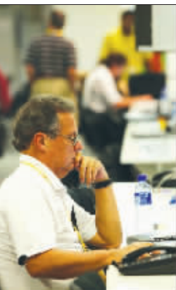
麻烦了,不算漏稿吧?