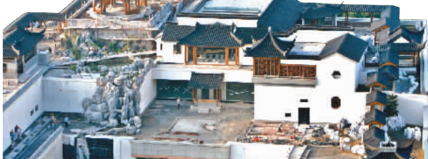
图中最高处就是楝亭