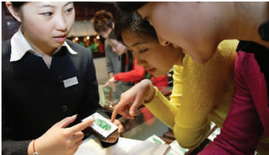
今年是奥运年,很多市民都想沾点奥运喜气,很多人抢生“奥运宝宝”,而给“奥运宝宝”佩戴一块翡翠祝福平安,更成为一股潮流。

今年是奥运年,很多市民都想沾点奥运喜气,很多人抢生“奥运宝宝”,而给“奥运宝宝”佩戴一块翡翠祝福平安,更成为一股潮流。“为自己,更为下一代珍藏”,TESIRO通灵“传世翡翠”成为当下不少人送给刚出生宝宝的特别纪念礼物。