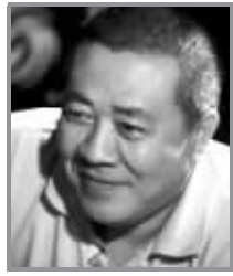
(博主系凤凰卫视主持人 博客地址:搜狐 更新时间:8月20日)

晚上回家,打开电视机,同时赶紧扑上去把声音收缩到最小最小。因为最近越来越受不得那些面目隆重的奥运主持人。