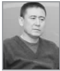
(博主系北京大学教授,著名社会学家 博客地址:新浪 更新时间:8月20日)

谁掌控和制作着体育话语?记者们。他们没少制作话语垃圾。明白的人懒得理论,糊涂的人跟着学舌,