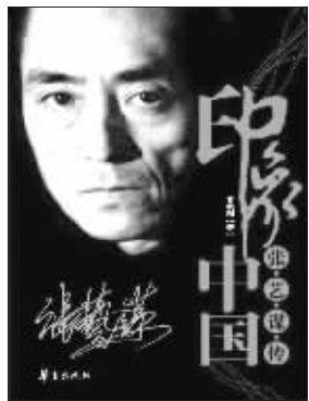
黄晓阳 著 华夏出版社友情推荐

北京奥运会开幕式完美谢幕了,总导演张艺谋的功力臻于炉火纯青。开幕式后,张艺谋在接受采访时说——我本质上就是一农民。