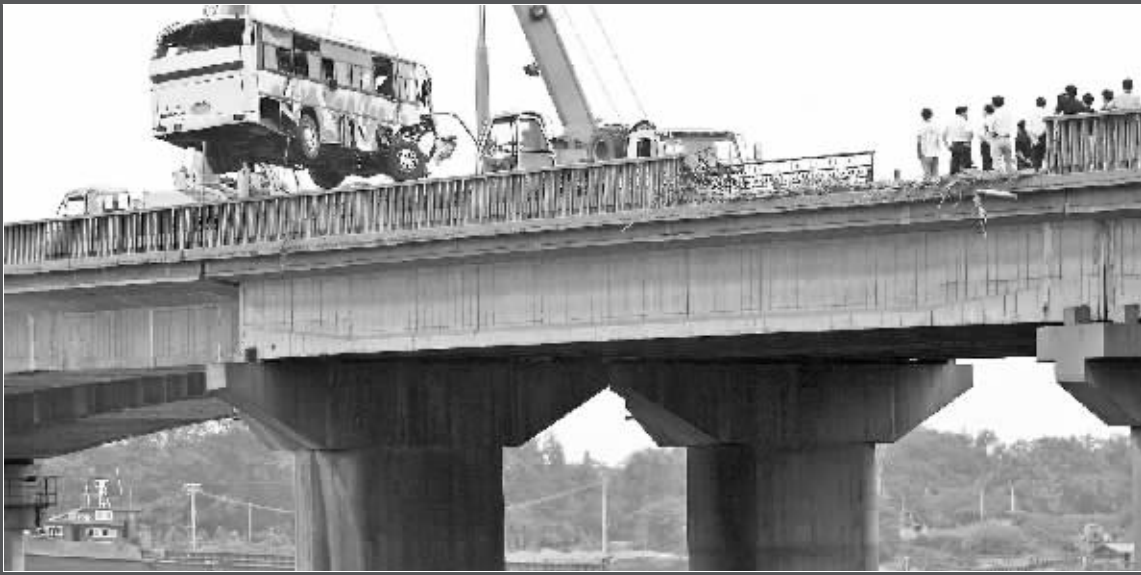
出事大巴正被吊上高高的桥面

事故发生后,省委书记梁保华、省长罗志军即作出批示,副省长史和平赶到扬州,到现场指挥抢救,又到医院看望伤员。扬州市领导在事发后第一时间赶赴现场,组织抢救。目前,事故原因仍在调查之中。 综合