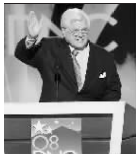
身患癌症的泰德·肯尼迪

美国民主党资深参议员泰德·肯尼迪(即爱德华·肯尼迪)是遇刺的前总统约翰·肯尼迪最小的弟弟,也是目前肯尼迪家族政坛三兄弟中硕果仅存的一位。76岁的泰德·肯尼迪今年5月不幸患上癌症,可能只剩下不到1年寿命。泰德将出版一本自传,自传中最为惊人的秘密是——他竟一直疯狂暗恋大哥哥肯尼迪的遗孀——杰奎琳·肯尼迪长达40年!