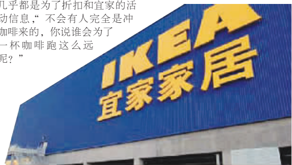
全国各地宜家的粉丝实在不少

让人哭笑不得的是,这篇博文的作者谴责那些喝免费续杯咖啡和贪小便宜拿白砂糖往包里塞的人,并乱扣素质低的大帽子,可博文的最后,作者却表示自己要去“吃白食”,“下周就可以回去了,国庆我来了。大假去哪呢,可以考虑跟武汉团去瑞典,去蹭吃蹭喝”(原文)。